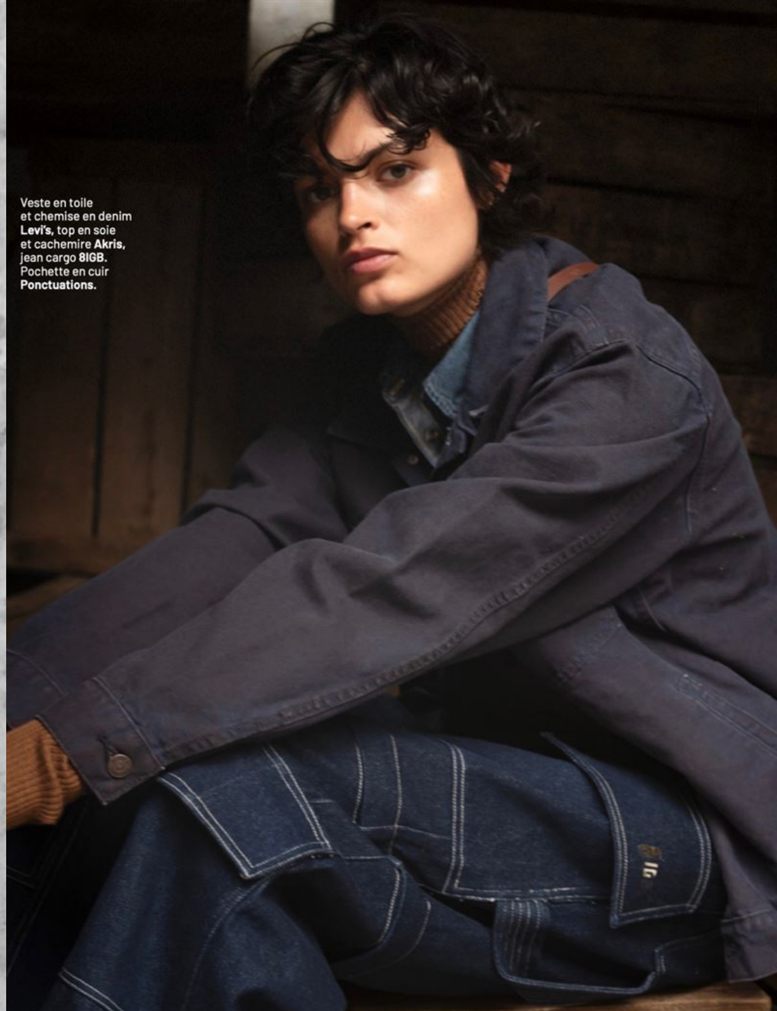
Veste en toile et chemise en denim Levi's , top en soie et cachemire Akris , jean cargo 8IGB . Pochette en cuir Ponctuations .