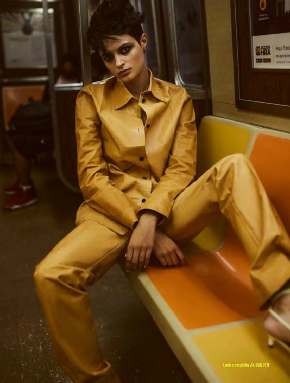
Look completo JIL SANDER