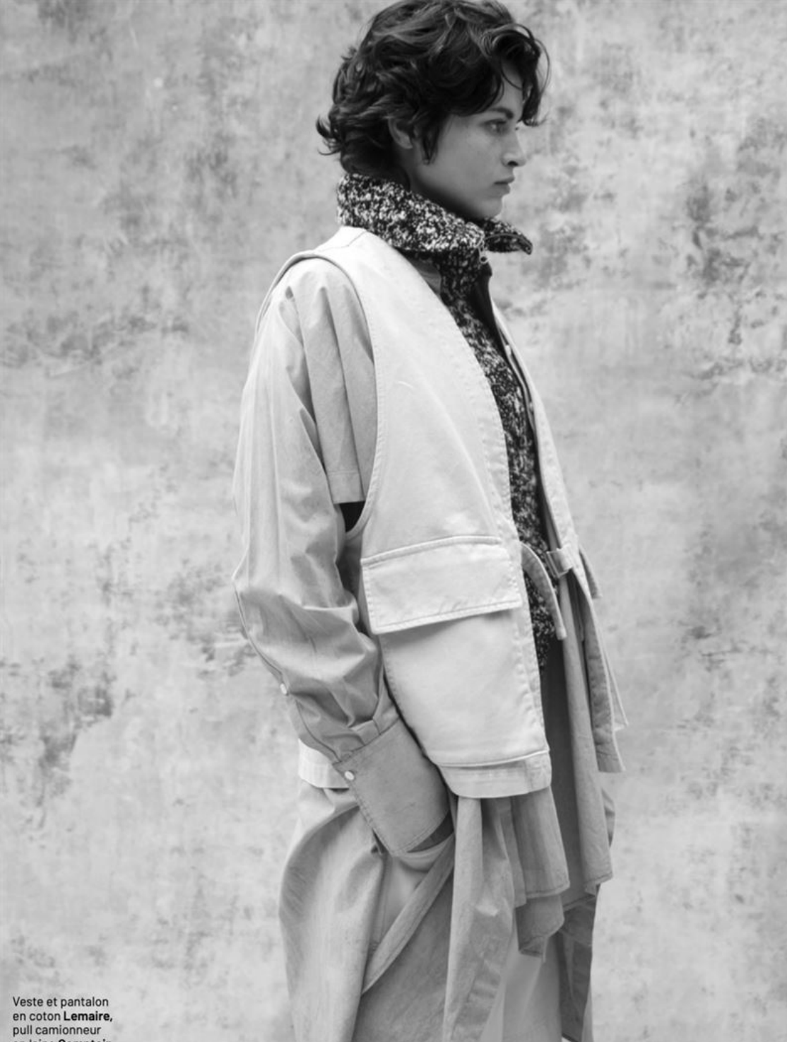
Veste et pantalon en coton Lemaire , pull camionneur en laine Comptoir