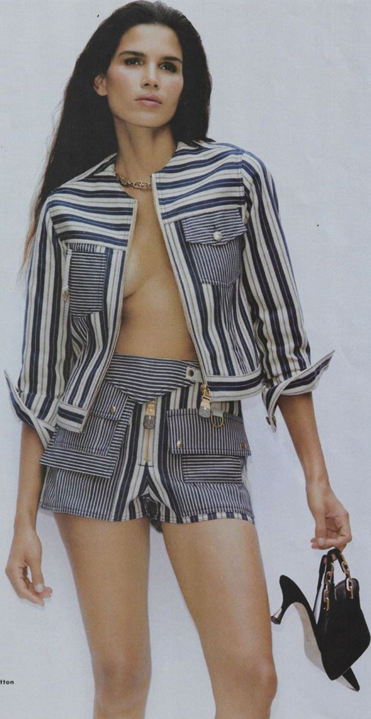
Jaqueta, R$ 19.000, shorts, preço sob consulta, pump, R$ 8.200, color, R$ 5.500, Louis Vuitton