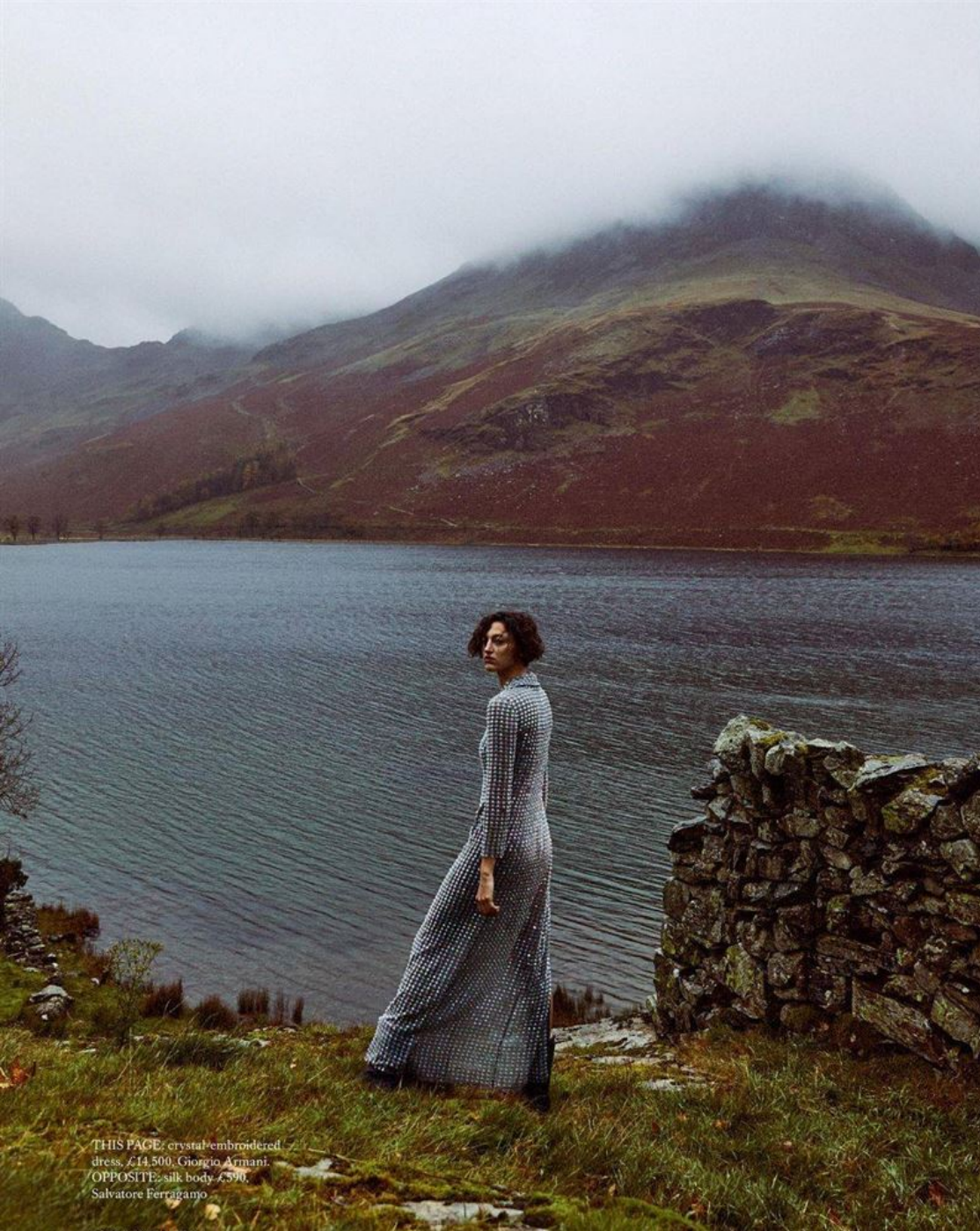
THIS PAGE: crystal-embroidered dress, £14,500, Giorgio Armani. OPPOSITE: silk body, £590, Salvatore Ferragamo