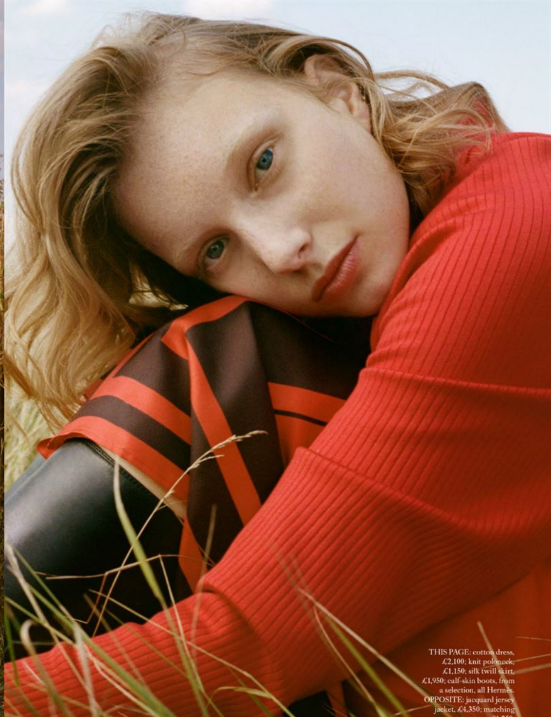
THIS PAGE: cotton dress, £2,100; knit poloneck, £1,150; silk twill skirt, £1,950; calf-skin boots, from a selection, all Hermès. OPPOSITE: jacquard jersey jacket, £4,350; matching