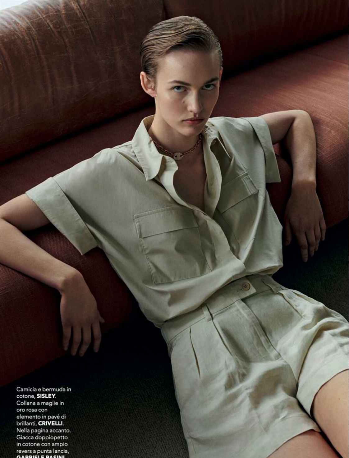
Camicia e bermuda in cotone, SISLEY . Collana a maglie in oro rosa con elemento in pavé di brillanti, CRIVELLI . Nella pagina accanto. Giacca doppiopetto in cotone con ampio revers a punta lancia, GABRIELE PASINI .