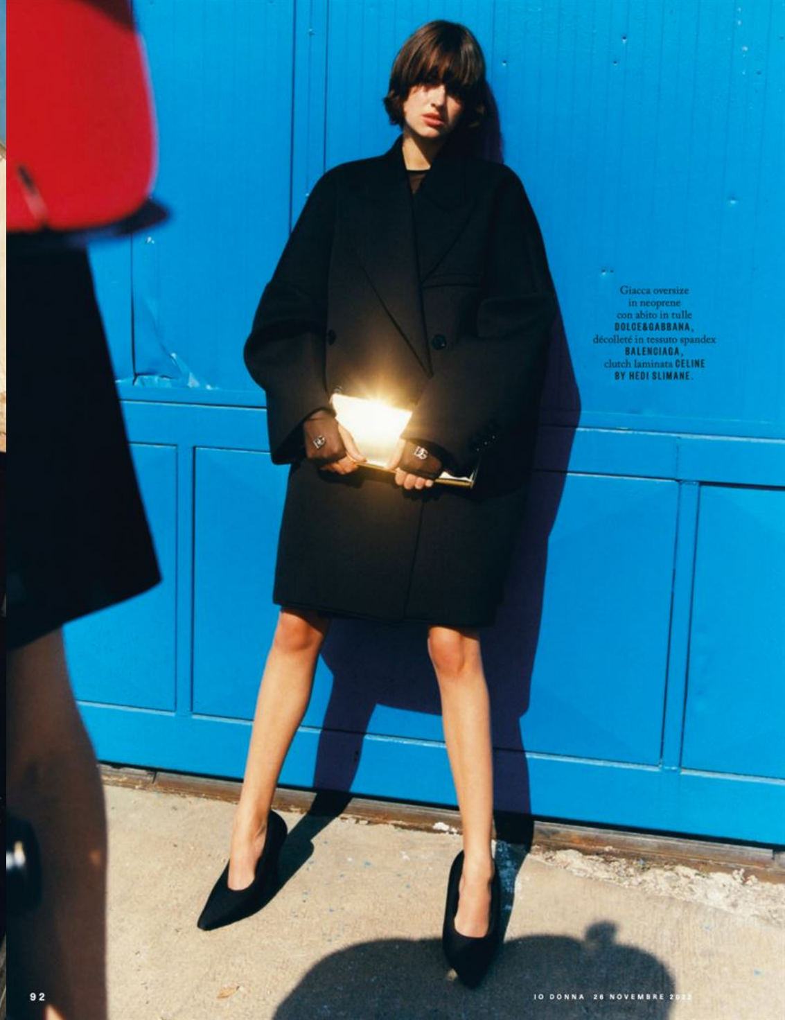
Giacca oversize in neoprene con abito in tulle DOLCE&GABBANA, décolleté in tessuto spandex BALENCIAGA, clutch laminata CELINE BY HEDI SLIMANE.