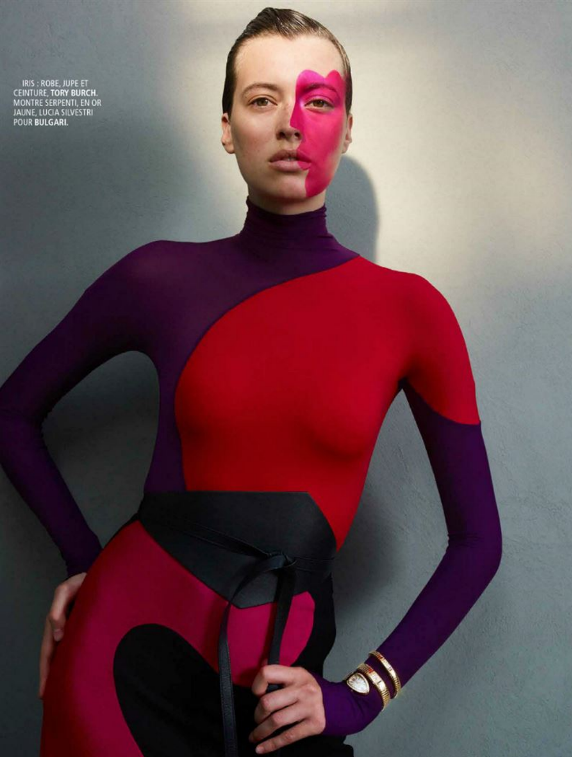
IRIS : ROBE, JUPE ET CEINTURE, TORY BURCH. MONTRE SERPENTI, EN OR JAUNE, LUCIA SILVESTRI POUR BULGARI.