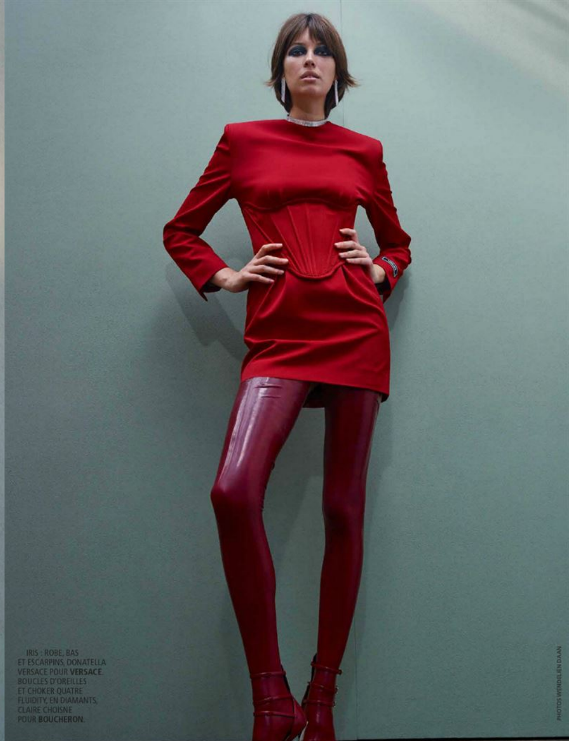
IRIS : ROBE, BAS ET ESCARPINS, DONATELLA VERSACE POUR VERSACE. BOUCLES D'OREILLES ET CHOKER QUATRE FLUIDITY, EN DIAMANTS, CLAIRE CHOISNE POUR BOUCHERON.