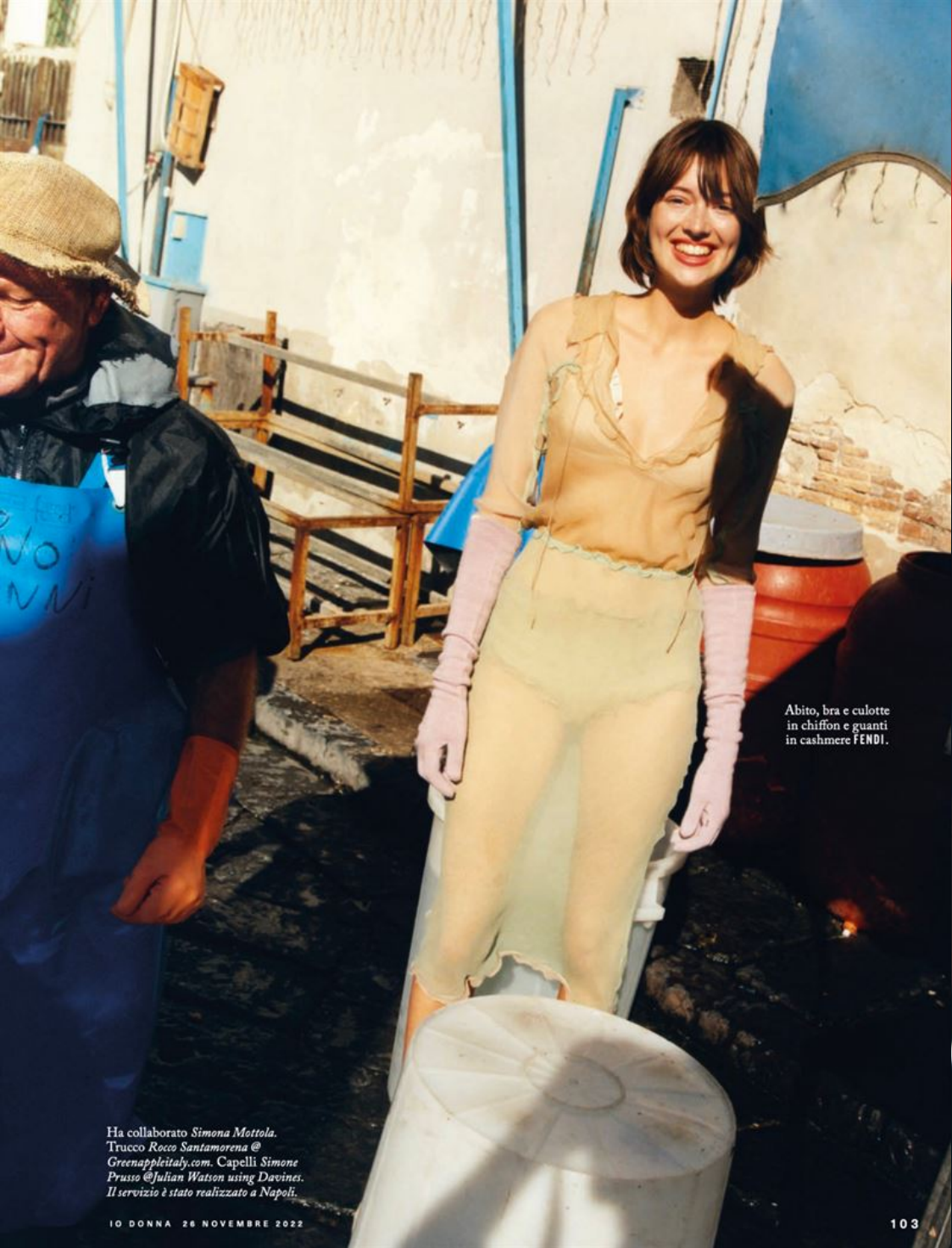
Abito, bra e culotte in chiffon e guanti in cashmere FENDI.

Ha collaborato Simona Mottola . Trucco Rocco Santamarena @ Greenappleitaly.com . Capelli Simone Prusso @ Julian Watson using Davines . Il servizio è stato realizzato a Napoli .