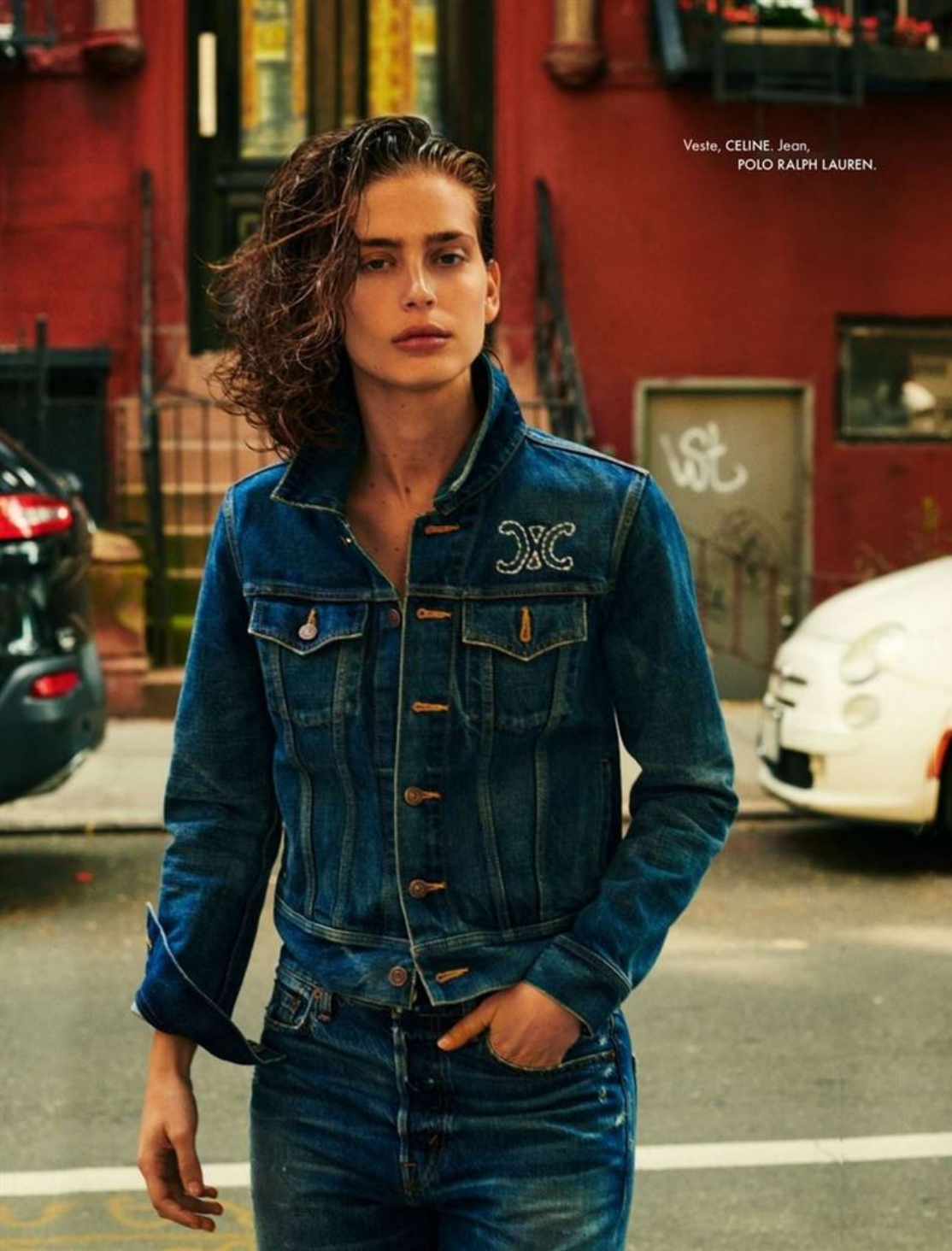
Veste, CELINE. Jean, POLO RALPH LAUREN.