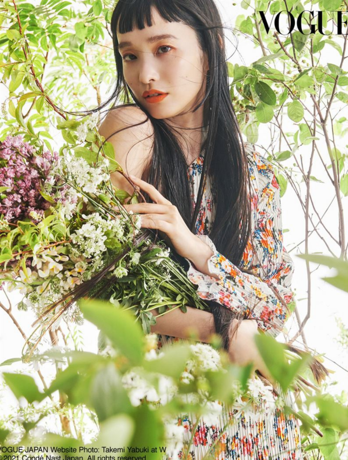
VOGUE JAPAN Website Photo: Takemi Yabuki at W © 2021 Condé Nast Japan. All rights reserved